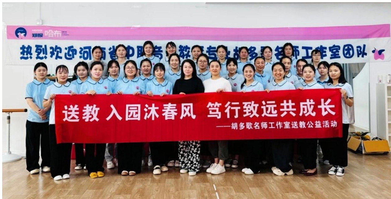
图 4-1 赴郑报哈布双语幼儿园开展公益送教活动