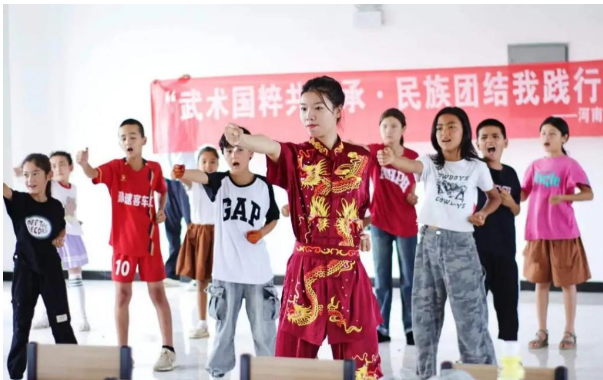
图 4-8 开展武术教学活动