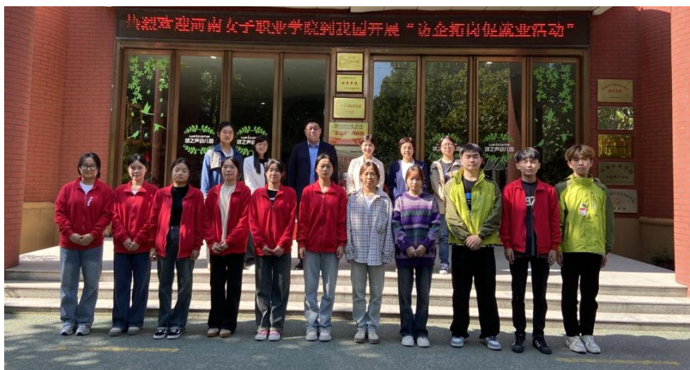
图 7-1 赴企业看望实习生

学校对学生实习工作非常重视，教务处与各二级学院到实习单位的走访活动将持续进行。通过走访，学校能够及时掌握实习学生的情况，加强校内实习指导教师与实习单位的沟通，更好地对实习学生进行专业指导，同时也将进一步推进学校和企业之间的合作交流，为人才培养质量的提升奠定良好的基础。