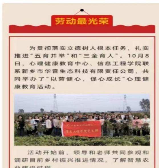
图 2-10 以心育人，五育并举

牢记教育初心，提质增效管理服务。一是强化学生管理工作信息化建设，升级学生工作信息化平台，搭建“一主八辅”学生意见反馈通道，完善接诉即办机制。二是成立大学生一站式服务中心，紧紧围绕学生帮困助学、权益维护、学生管理等需求，由“方便管理者”向“方便学生”进行转变。三是深入实施共青团促进大学生就业行动，依托“团团帮就业”线上服务平台，常态化提供就业服务，推进创业帮扶、“扬帆计划”“千校万岗”等项目和活动