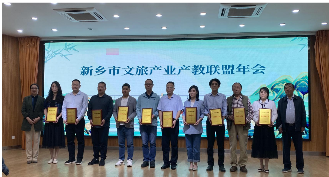
图 4-2 市域产教联合体