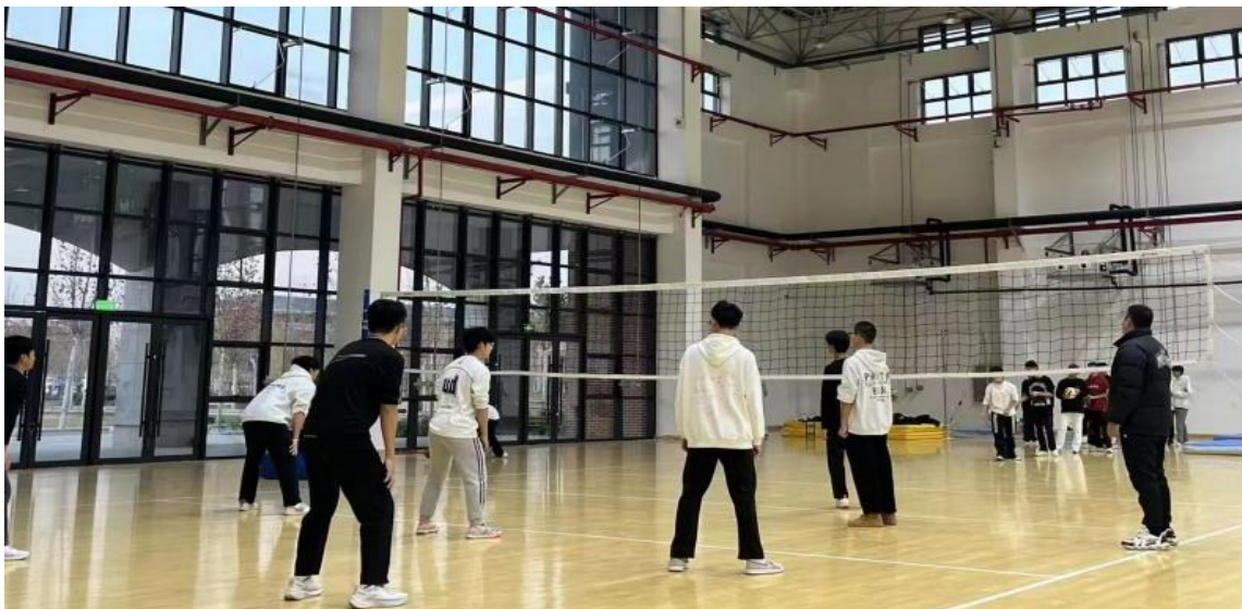
图 5-3 开展排球运动

除了武术这一特色项目外，篮、足、排三大球运动培养了学生的团队协作能力和竞技精神，网球、羽毛球、健美操、啦啦操、街舞等项目则以其独特的魅力吸引了众多学生参与，锻炼了他们的身体协调性和反应速度。