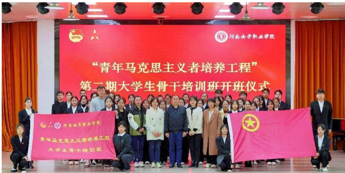
图 2-9 青马班开班

建立四级预防网络，做好学生心理健康教育。学校建立完善心理危机干预网络及干预机制，涵盖学校心理健康教育中心、学院二级心理工作站、班级、宿舍四级网络架构。一是完善我校心理健康教育中心的制度建设，规范咨询服务，树立“从心开始，快乐起航”的心理育人理念，形成教育教学、实践活动、咨询服务、预防干预、平台保障“五位一体”的心理健康教育工作格局。二是加强人文关怀和开展心理健康教育工作，培养学生自尊自信，理性平和，积极向上的健康心态，推动学生茁壮成长。三是设立、优化多渠道的心理援助方式，开通心理咨询预约通道、心理热线和 24 小时心理援助 QQ，学生通过公众号、扫码、现场预约等多渠道进行线上线下的心理咨询。推行线上心