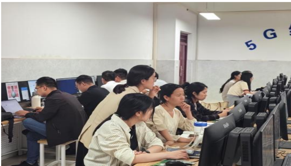
图 3-2 现代教学能力培训

继续推进现代教学能力提升和考核工作。锻炼和提高了教师的现代教学能力，熟练运用信息化教学手段成为我校教师无论日常教学还是参赛的必备技能。我校实施现代教学能力评价以来，经过对比往年数据可以明显看到，课堂活动、章节测验、互动讨论和任务点完成等主要指标获得大幅度增长，学生到课率由 89.81% 提升到 91.34%，为进一步促进我校教学质量的稳步提升，为职业教育提质培优、增值赋能贡献了力量。