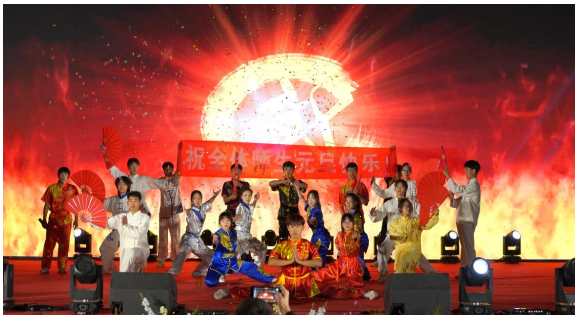
图 2-12 校武术社团表演武术《武韵》

及不同社团间的交流合作，展现社团文明风采、发挥社团育人功能，2023年12月28日，学校举办了“第一届大学生社团文化艺术节”，武术社、追梦舞蹈社、流行音乐社、爵士街舞社、追光合唱团、健美操社团、礼仪社等社团成员纷纷展示各类才艺，向同学们呈现一场场精彩的演出。