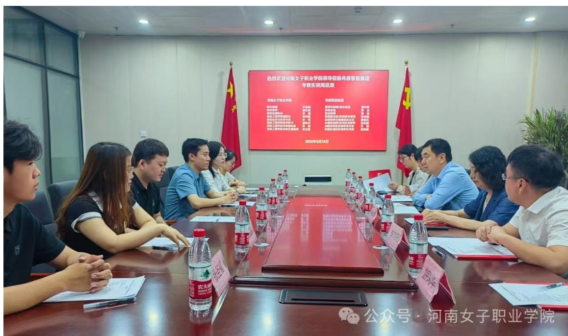
图 2-11 领导带队访企拓岗

学校秉持“以服务为宗旨、以就业为导向”的理念，深度融入学校教育质量提升工程。通过构建长效稳定的工作机制，不断完善就业服务体系，充分发挥全校资源优势，逐步提升就业指导服务的专业化与精细化水平，全面推动毕业生迈向更高质量的就业新台阶。