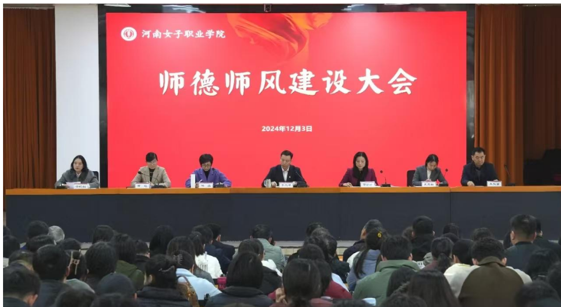
图 2-2 学校召开师德师风建设大会