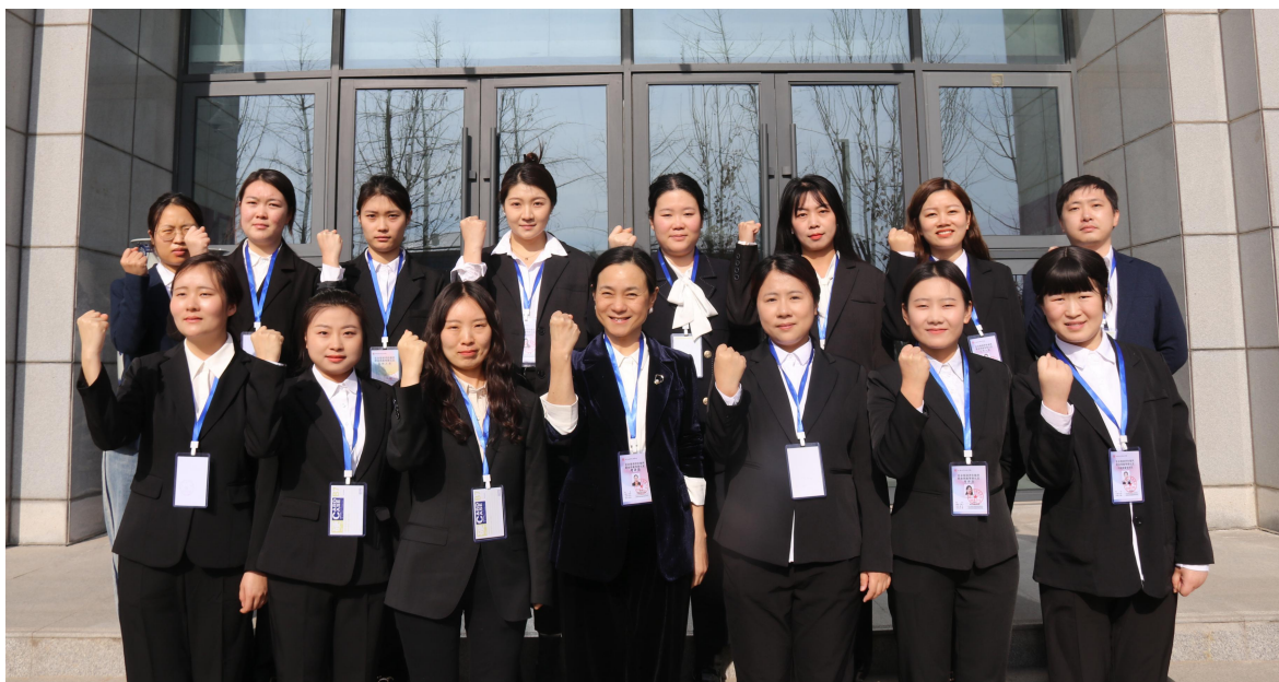
图 4-11 河南省妇女第十四次代表大会会务工作人员