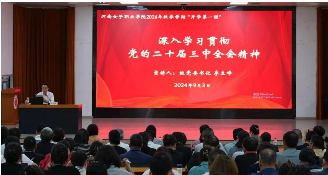
图 8-22024 年秋季学期“开学第一课”

民共和国职业教育法（修订草案）》等文件。学校深刻领会国家和地方政策的重大意义，并将其落实到学校事业的方方面面。一是坚持立德树人。聚焦女校特色。聚焦产业发展，对接经济社会发展新技术、新产业、新业态、新模式，创新岗课赛证人才培养新模式。聚焦学生需求，深入推进“三教”改革，构建“三全育人”新格局。二是坚持产教融合。探索政行企校“四元同构”体制机制，牵头成立河南省早期教育职教集团、河南省学前教育专业联盟，搭建校企合作平台。三是坚持创新发展，着力提升社会服务水平。立足主责主业，在服务儿童发展、服务妇女发展、服务乡村振兴、服务技能振兴等方面展现新担当新作为。