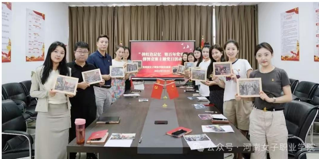
图 8-1 主题党日活动

个确立”的决定性意义。四是落实党管意识形态责任制。着力建好三支队伍（思政课教师队伍、辅导员队伍和舆情监控队伍），管好宣传思想阵地（课堂阵地、文化阵地、学术阵地、网络阵地、社团阵地），做好统一战线工作。