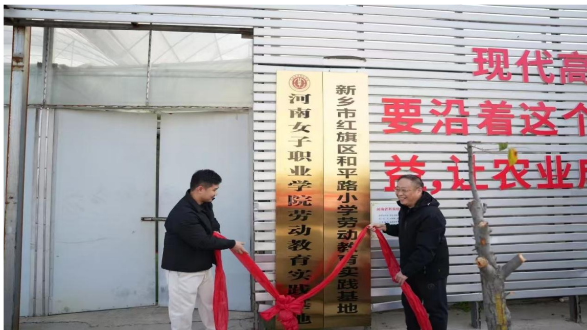
图 2-8 建立校外劳动教育实践基地

优化育人体系，形成育人合力，学校围绕立德树人根本任务，形成网状覆盖的组织育人工作体系。一是党建引领团建，使党组织育人与团组织育人达到点与面的良好结合、条和块的合理穿插，加强党组织的感召力和渗透力，有效提升了学生社团组织的育人功能。二是聚焦薄弱环节，建立健全“三会两制一课”“推优入党”等制度，推进学生会团建、社团建团、网络建团，扩大团的组织和工作覆盖，发挥政治把关和思想引领作用，守牢安全底线。三是聚焦关键少数，建立健全团学干部队伍教育培训体系，深入实施“青年马克思主义者培养工程”，建设四级团学干部常态化、长效化理论学习机制，由各党支部书记上党课、思政课教师上团课，带动团干部上讲台讲党团课。