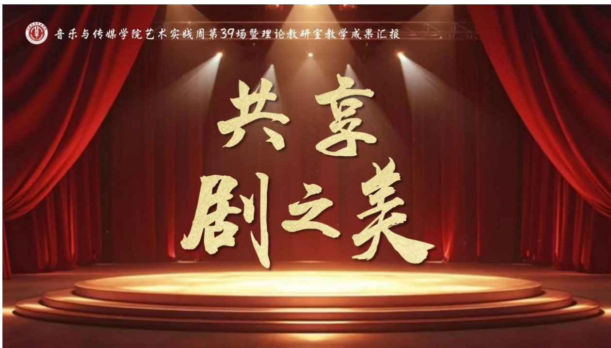
图 5-2 “共享剧之美”艺术实践周

与独特魅力。活动不仅是两校之间的深度交流与合作，也是我校美育浸润校园行动的重要举措，对提升学生的艺术素养和传承中国传统文化具有重要意义。