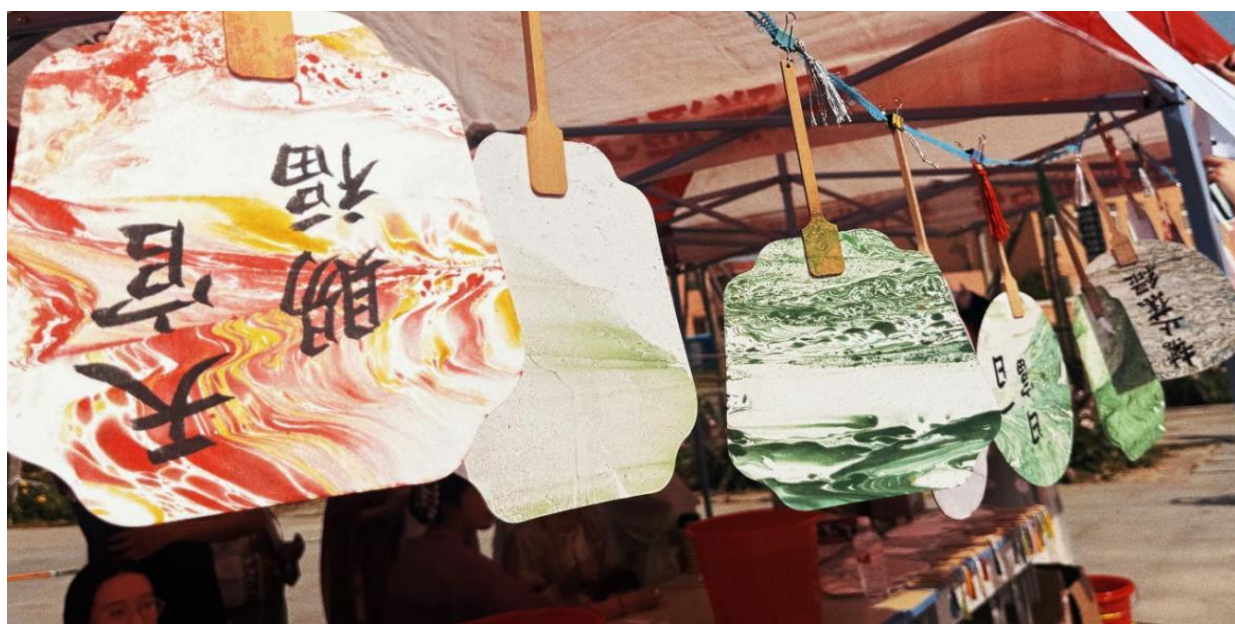
图 5-5 同学们制作好的漆扇成品展示