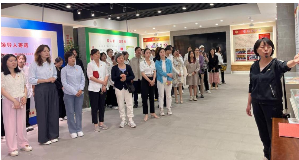
图 5-1 裴寨研学活动

史”特色活动 7 期，通过鉴赏画作内容，了解作品反映出的党史背景和艺术成就，回顾中国共产党百年发展历程和取得的主要成就，强化思政教育内涵。开展“红色故事”美术刻纸作品展，为全校师生呈现一堂生动的党史学习教育课。二是提升组织引领，强化实践育人。为坚定积极分子理想信念，党总支组织党员和积极分子于 2024 年 4 月 26 日在裴寨村红色基地开展研学活动，深切领会裴寨村史党建展览馆内所彰显的使命担当，增强社会责任感和使命感，坚定理想信念，强化使命担当。三是立足专业实践，丰富活动形式。为创新、丰富学生红色教育的内容和形式，将课堂由校内课程延伸到校外实践，开展了“用艺术之笔，点缀校园之美”校园墙绘主题教育实践活动。开展以美润心，向美而行——“井”上添花，“艺”气风发井盖涂鸦活动。