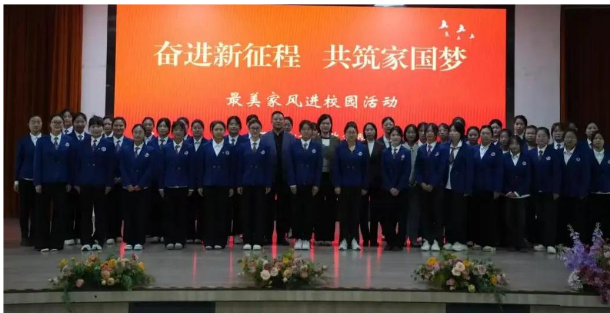
图 4-13 开展最美家风进校园活动

10月24日,全国妇联、中国人民大学联合主办的“奋进新征程 共筑家国梦”最美家风进校园活动在京举行。学校作为全国百所联动高校之一,积极组织师生参与同步联动,并以此次活动为契机,继续创新形式,将优秀家风文化带入校园,影响和激励更多女院学子,共同为实现“中国梦”凝聚青春力量。