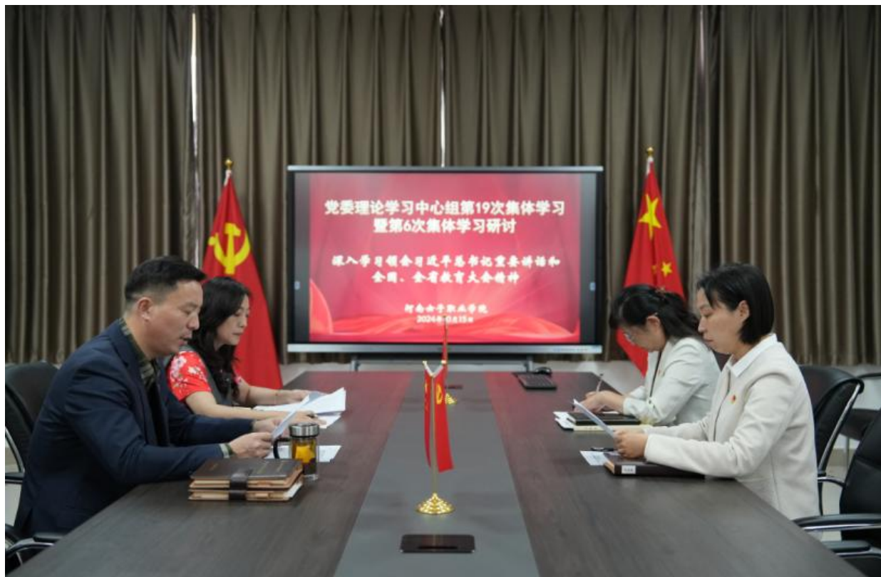
图 2-1 党委理论学习中心组举行集体学习

强化师德师风建设，筑牢教育根基。为强化教师职业道德修养，严格规范教育行为，积极营造优良的育人环境，学校以着力培养“四有”好老师、大力弘扬教育家精神为目标，实施师德师风一票否决制。召开师德师风建设大会、组织师德师风承诺书签订仪式，多次邀请省内外知名专家开展“新时代师德师风建设与弘扬教育家精神”专题培训。不断创新工作举措，设立师德师风示范教师岗位，为打造一支具备高素质与专业化水准的教师队伍奠定了坚实的基础。