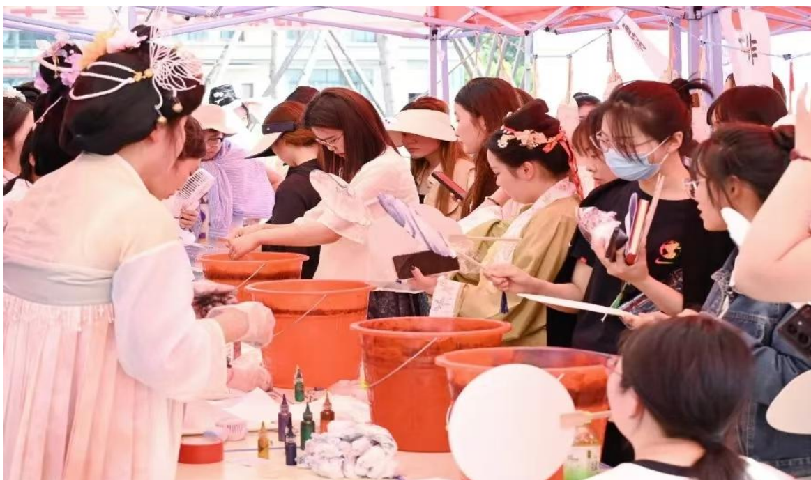
图 2-6 国风文化节现场

共获得奖项 60 项。我校师生在《百姓家》系列活动中取得优异成绩，得到多家主流媒体的宣传报道。