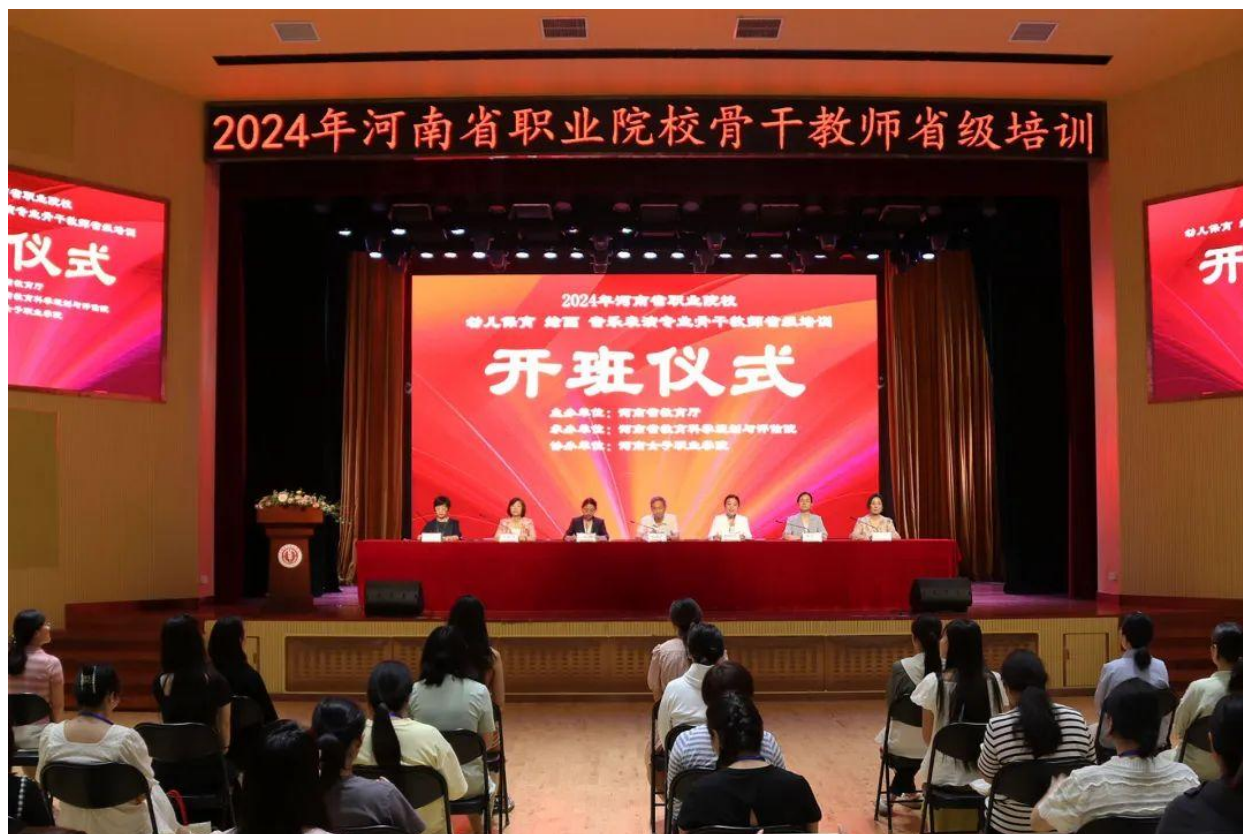
图 4-10 河南省职业院校骨干教师省级培训开班仪式

管理，确保培训质量，进一步提升参训教师的理论和技能水平，为河南省职业教育发展作出新的更大贡献。