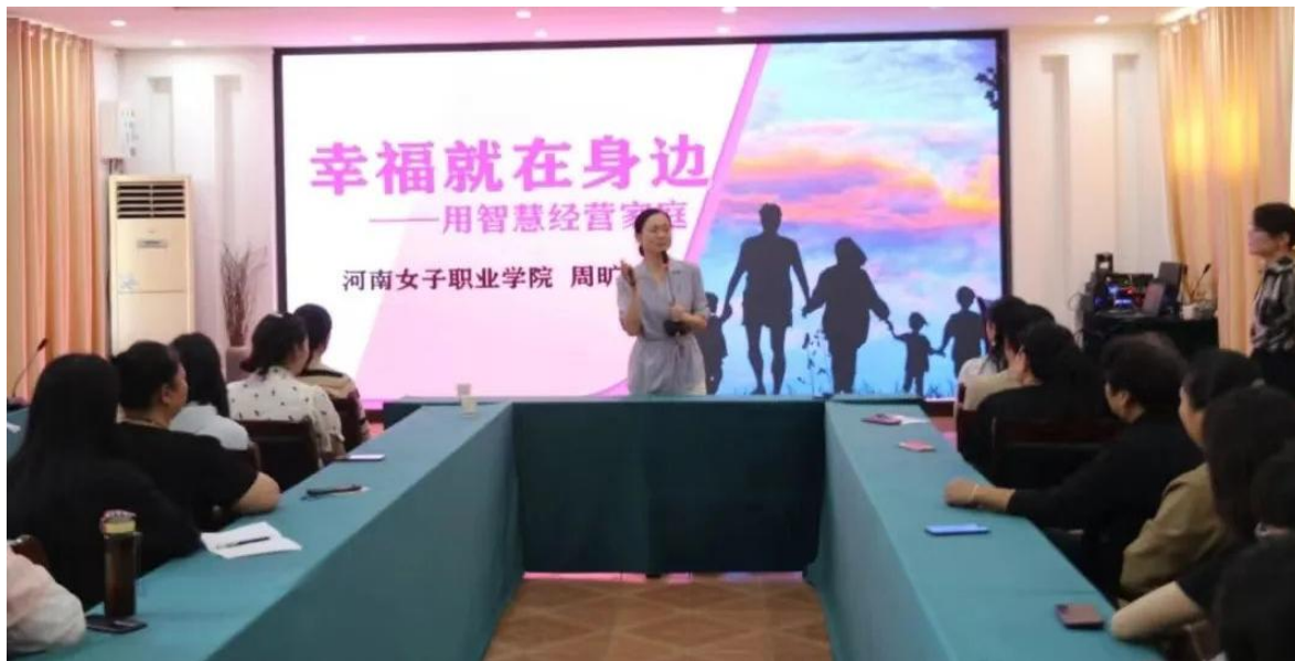
图 4-7 家庭经营课程

此次公益讲座是学校与亢村镇开展校地合作系列活动之一，不仅有助于妇女群众开展家庭教育、提升家庭幸福指数、打造和谐家庭，更有利于丰富群众精神文化生活，助力乡村文化振兴。今后，学校将把校地结对帮扶作为一项重要任务去落实，主动走出校园，充分发挥学校人才优势，担当责任，共同谱写校地发展新篇章，为乡村振兴贡献女院力量。