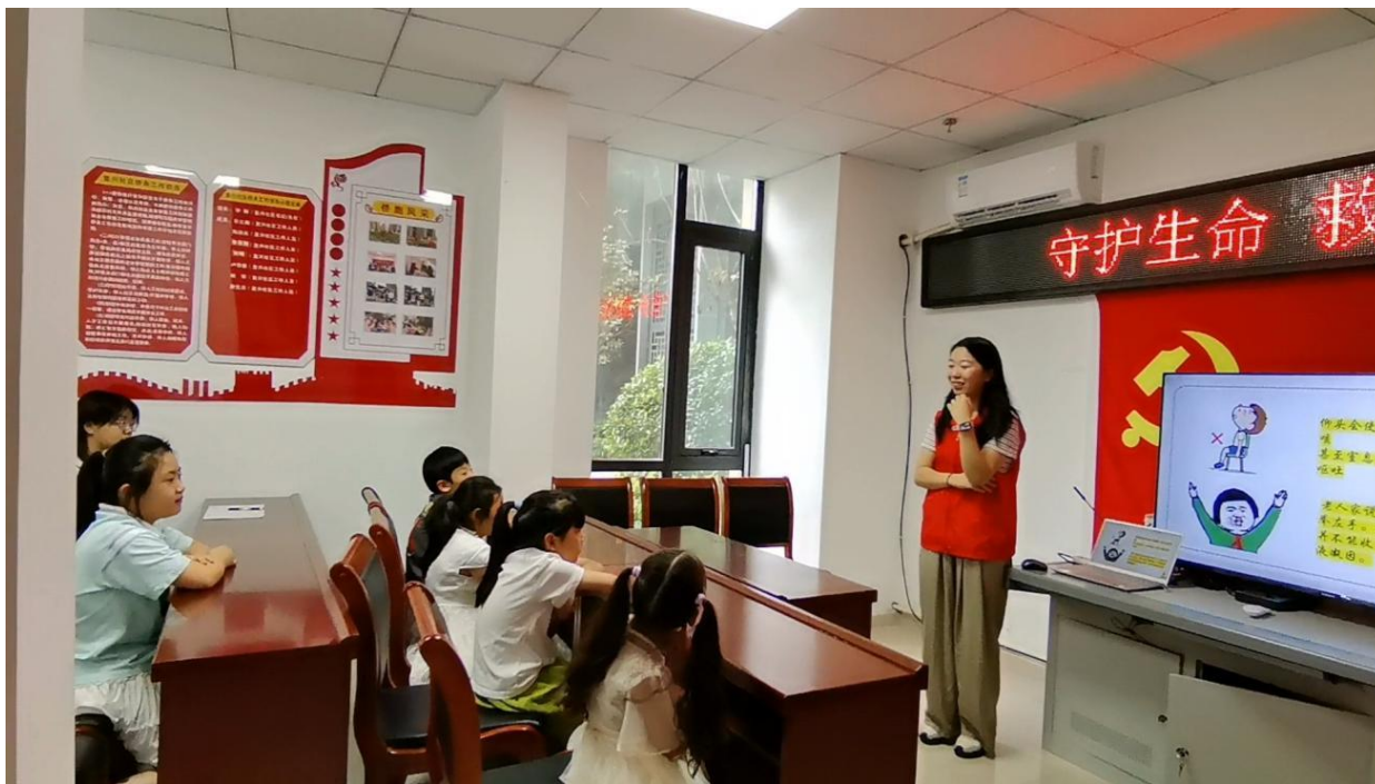
图 4-9 实践团队面向社区儿童开展安全教育活动