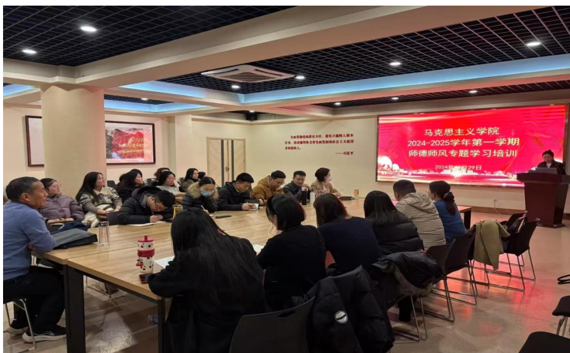
图 2-3 师德师风专题学习培训

多措并举，培育时代新人。一是育人工作制度化。学校制定了《中共河南女子职业学院委员会 2024 年宣传思想