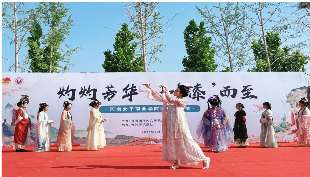
图 5-4 汉服社成员进行走秀表演