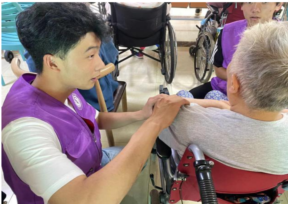
图 4-4 “情系夕阳 爱暖人心”志愿服务活动

了解，充分展现了大学生青年之使命、青年之担当。进一步激发了广大青年对社会的热情，践行“奉献、有爱、互助、进步”的志愿服务精神，为推动社会的高质量发展贡献青春力量。