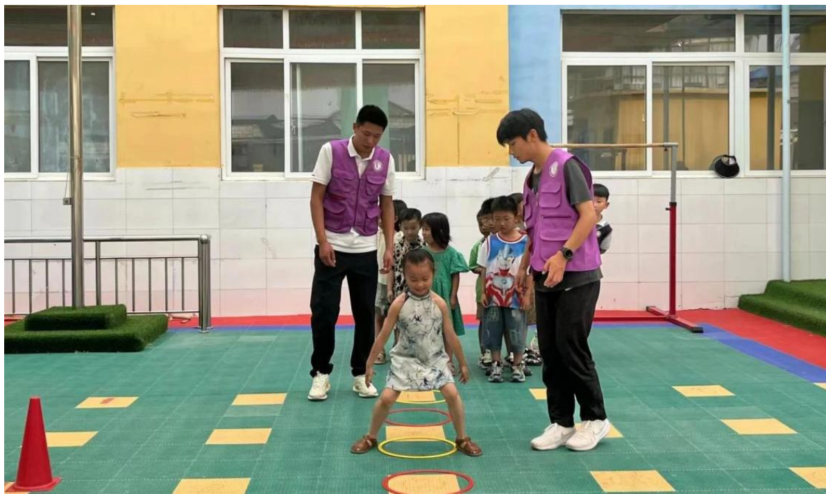
图 4-5 组织孩子们进行“叠桶接力”等游戏

作精神和关爱儿童的意识，体验到教育的乐趣和责任，明白了躬行实践的意义，展示了女院学子的美好风貌，让志愿服务精神蔚然成风。