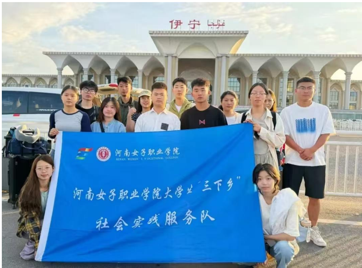
图 2-7 石榴籽心向党团队在新疆开展“三下乡”活动

在劳动育人方面，学校制定劳动教育实施方案，将劳动教育纳入人才培养全过程，每学期既有课程劳育，也有劳动实践，关键节点通过微信公众号、广播站、宣传栏、短视频等线上形式进行劳育文化宣传。同时，学校建立校外劳动实践教育基地，致力培养出全面发展的时代新人。