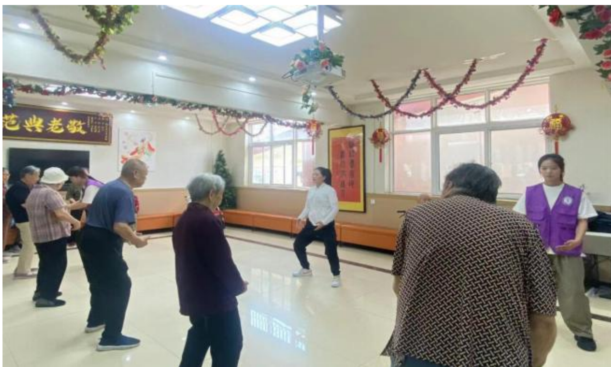
图 4-3 带领老人们进行头肩身体活动操

传承爱老敬老的高尚品德，践行尊老、敬老、爱老的优良传统，共同营造良好的社会风气，弘扬中华民族敬老爱老的传统美德，展现当代大学生的服务精神。